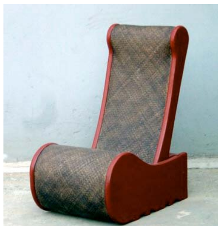
Riproduzione di lacca cinese per la replica di una seduta ribaltabile di epoca Ming.